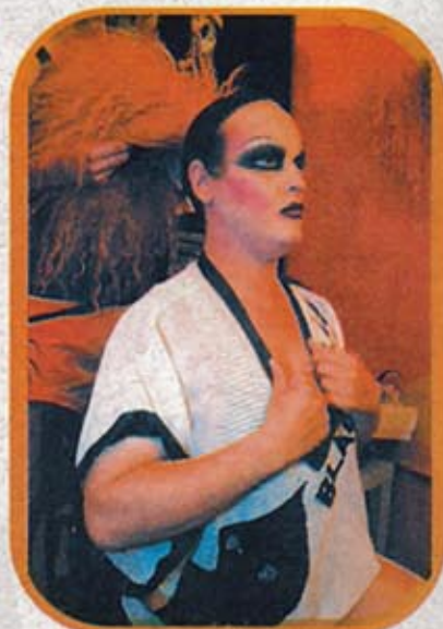
Mucho maquillaje y una indumentaria transgresora diseñada por Caume, en exclusiva, para La Troya.