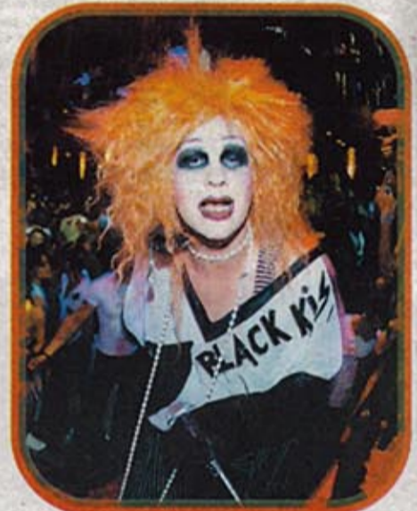
¡Voilà! La Troya en acción.