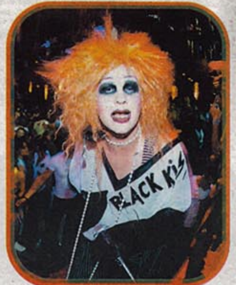
¡Voilà! La Troya en acción.