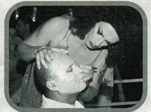
El público de la fiesta se sometió a intensas sesiones de maquillaje. La pista se convirtió en un divertido juego del quién es quién.