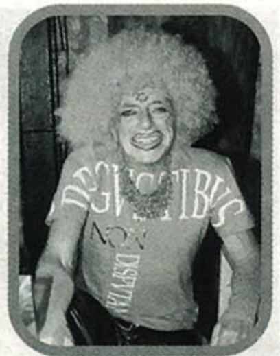
Hubo caracterizaciones para todos los gustos. Unas, eso sí, más conseguidas que otras.