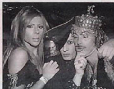
Un grupo de la Troya