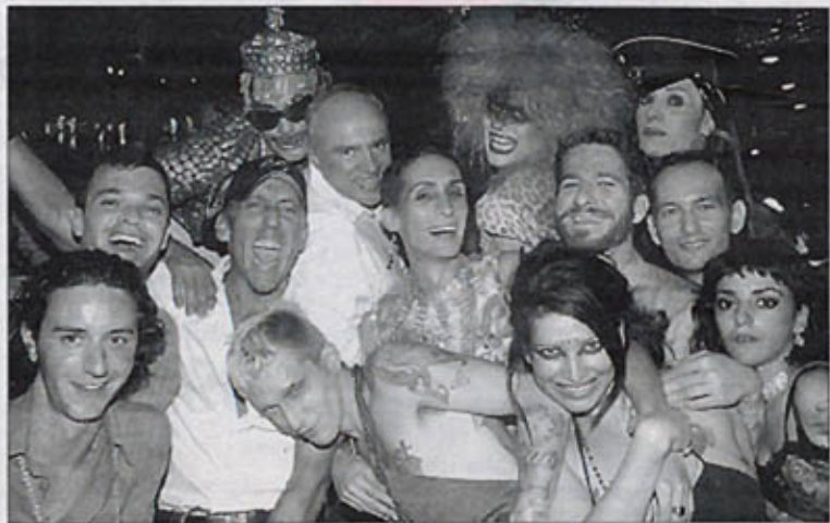
Brásilio junto a la familia de la Troya

Tras catorce encuentros este verano, la fiesta de Amnesia llega a su final con una de las mejores representaciones de dj Oliver