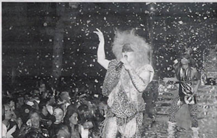
Marcelo Baby en un momento de su espectáculo

Los asistentes, como ya acostumbra en cada uno de los eventos de la Troya, se volvieron a acullillar en los bajones musicales dirigidos por el discjockey y a saltar y volverse locos en los momentos de más éxtasis rítmico que tienen lugar en la sala Amnesia.