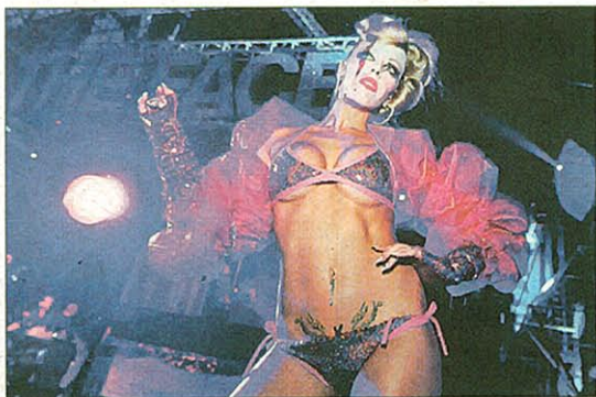
Una bailarina caracterizada