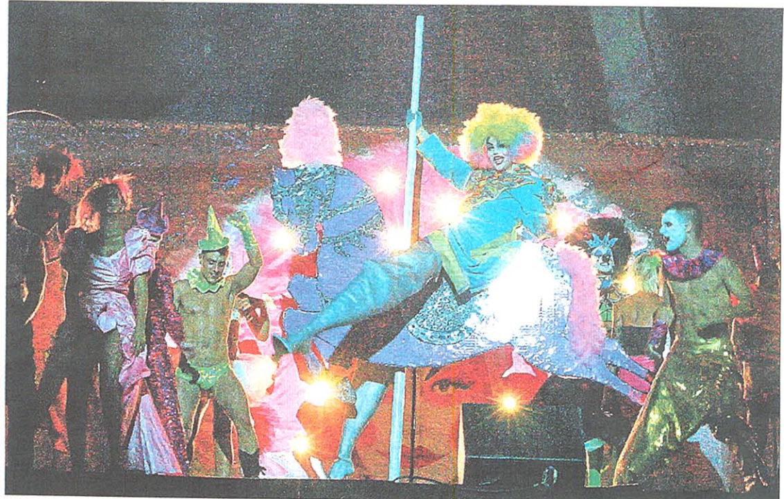
El caballo de colores pastel es la gran atracción de la noche alrededor de la cual bailan todos los artistas