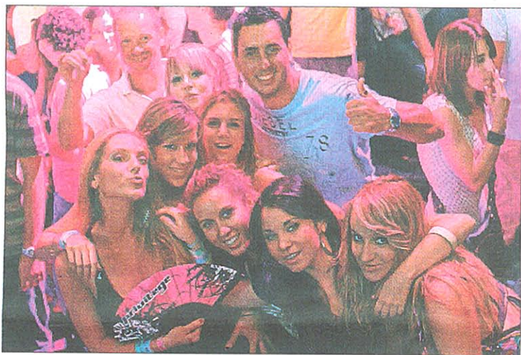
Un grupo de amigos disfruta de la noche en Privilege